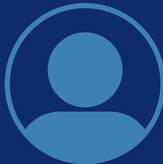
Secrétaire générale Vacant